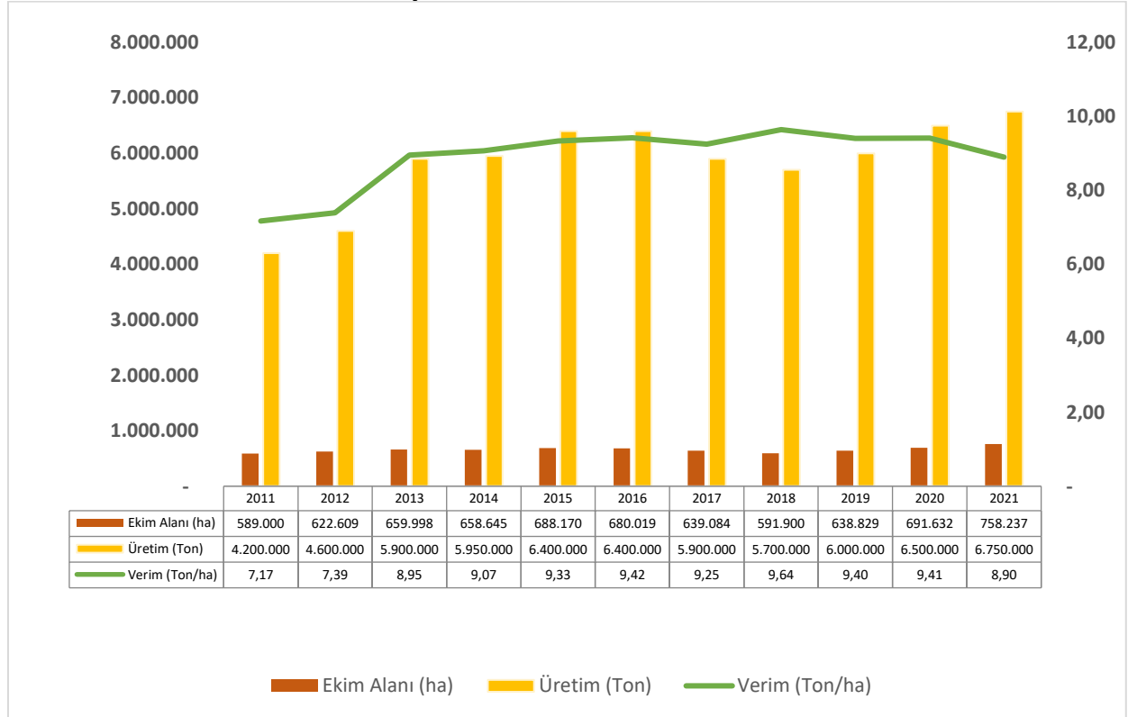
Grafik 2- 2011-2021 Döneminde Türkiye’de Mısır Ekim Alanı, Üretim Miktarı ve Verimlilik