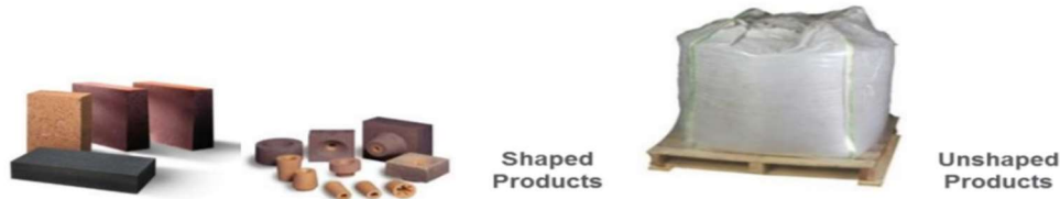
Görsel 3: Şekli ve Şekilsiz Refrakter Malzemeleri

(19) Ayrıca refrakter malzemeler kimyasal bileşenlerine göre bazik (temelli) ve bazik olmayan (temelsiz) refrakterler olarak da ayrıştırılabilmektedir 8 :