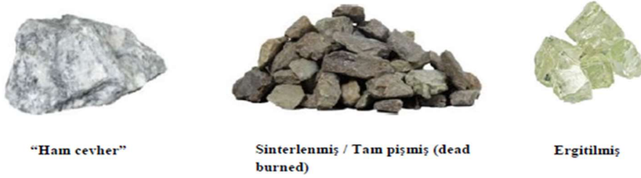
Görsel 2: Ham Cevher, Sinterlenmiş ve Ergitilmiş Ürünler

(17) Kullanılan ham maddelere ve işlenip işlenmediğine göre çeşitli kategoriler altında incelenebilen refrakter malzemeleri, fiziki şekillerine göre de ikili bir ayırmada kategorize edilebilmektedir: 7